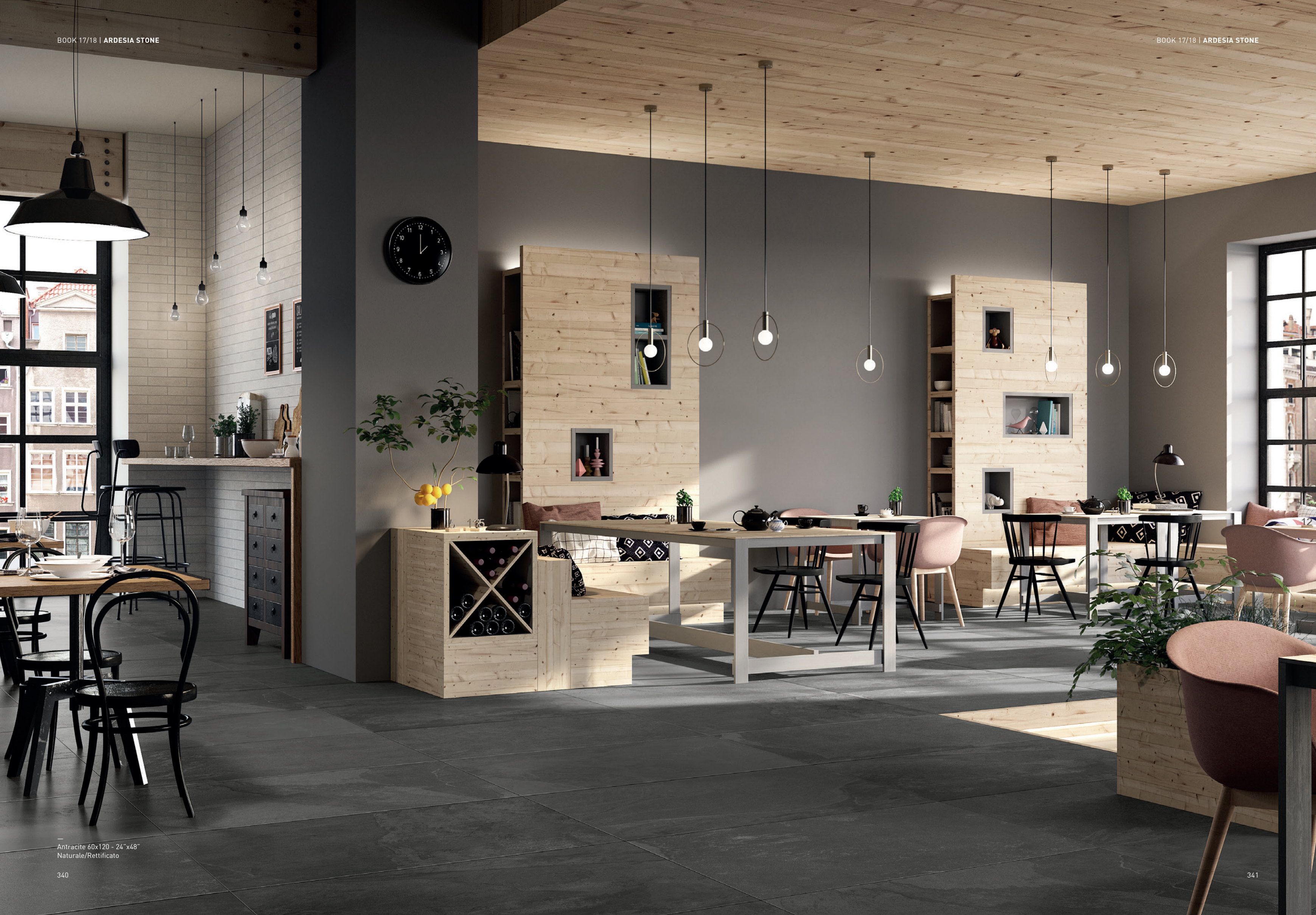
Antracite 60x120 - 24"x48" Naturale/Rettificato