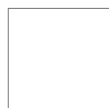
60x60 - 24"x24" NATURALE/RETTIFICATO