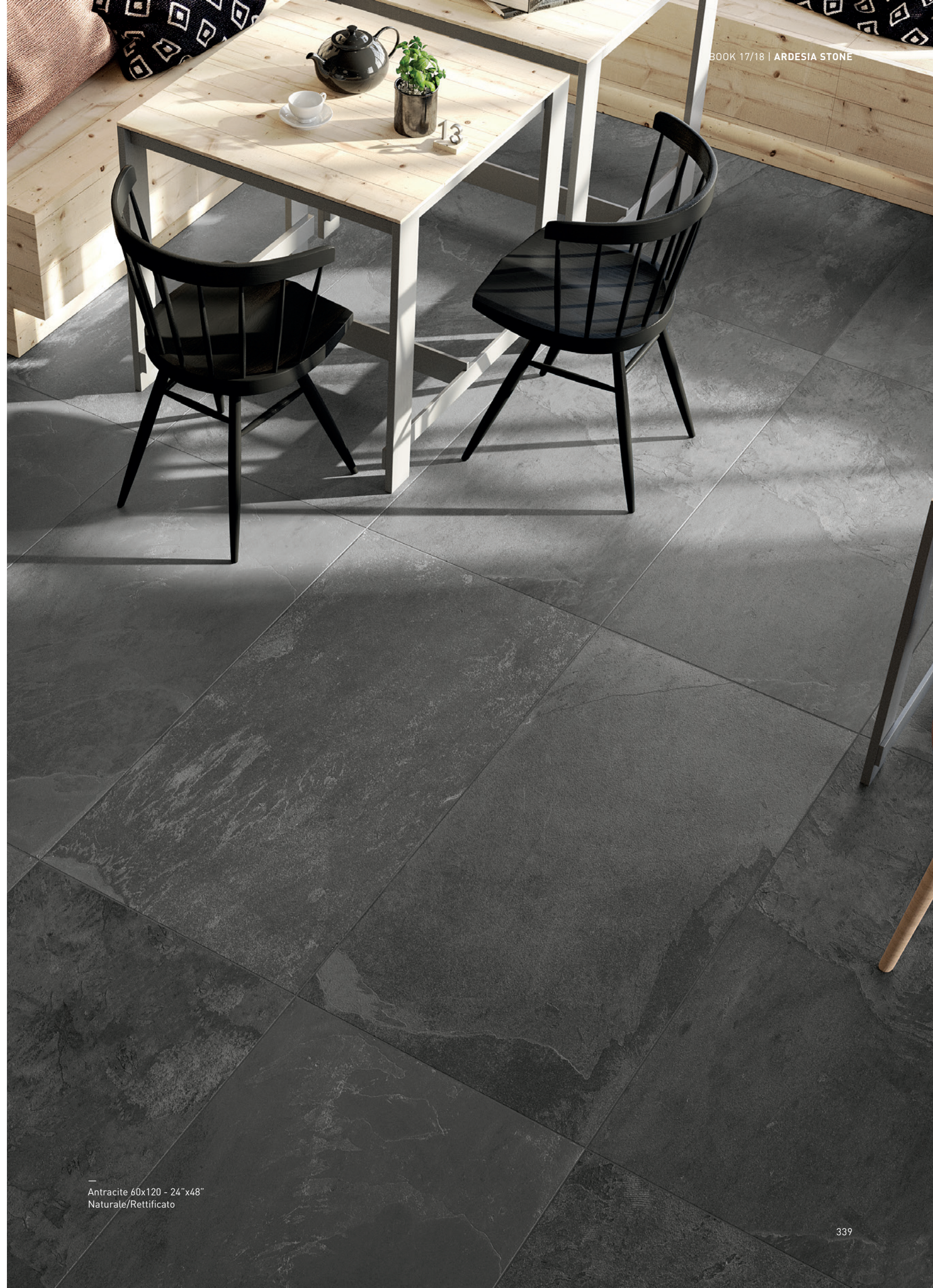
Antracite 60x120 - 24"x48" Naturale/Rettificato