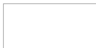
60x120 - 24"x48" NATURALE/RETTIFICATO