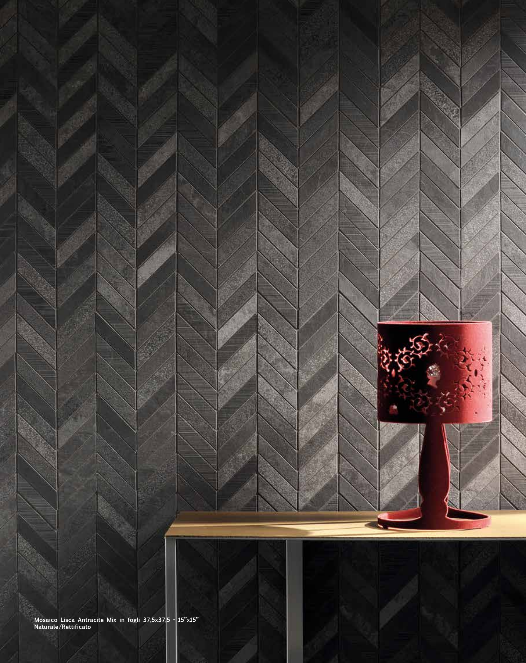
Mosaico Lisca Antracite Mix in fogli 37,5x37,5 - 15"x15" Naturale/Rettificato