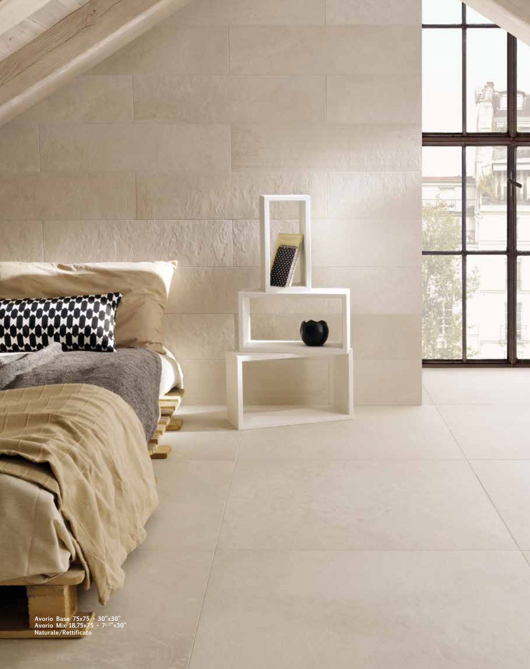
Avorio Base 75x75 - 30"x30" Avorio Mix 18,75x75 - 7 1/2"x30" Naturale/Rettificato