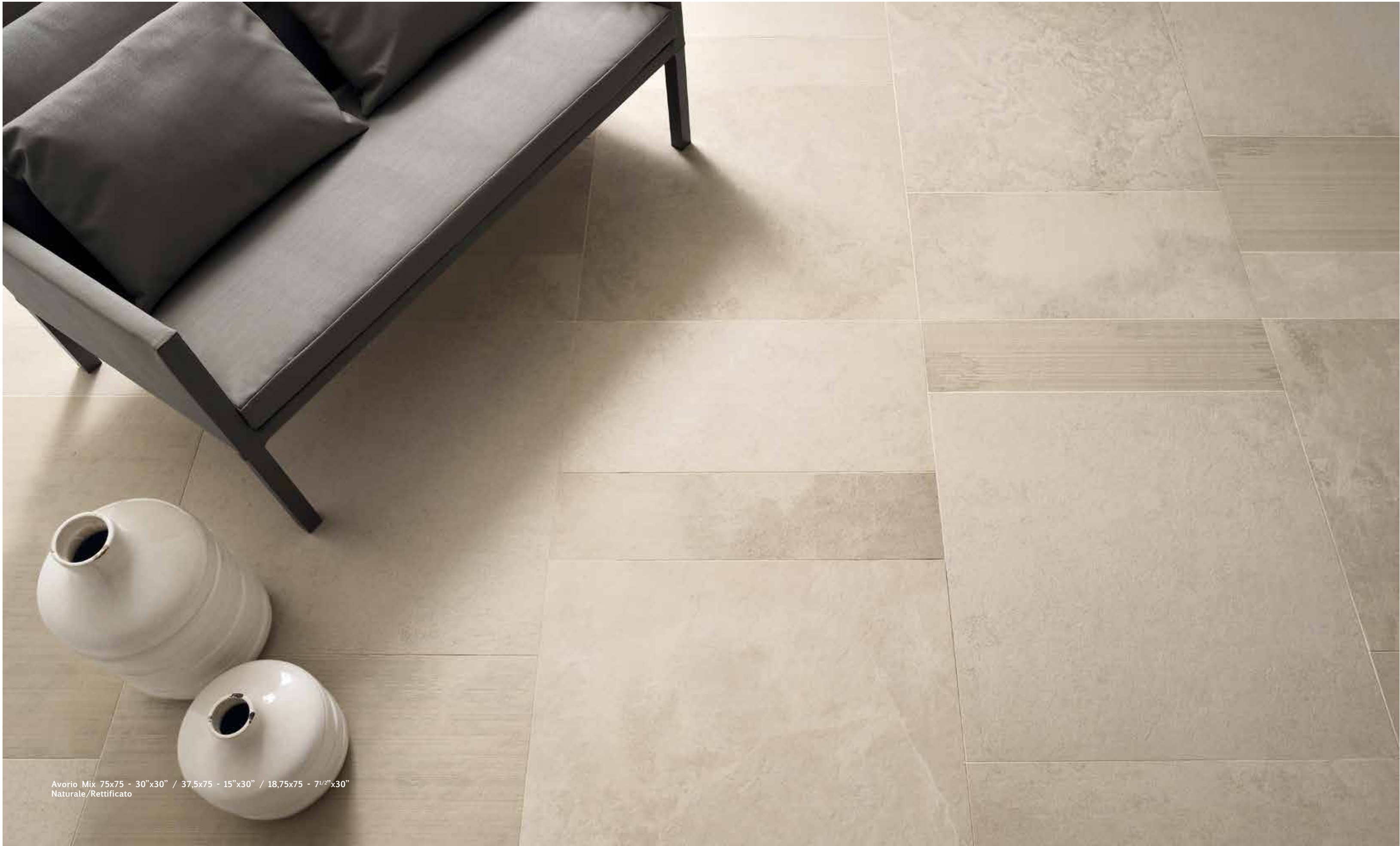
Avorio Mix 75x75 - 30"x30" / 37,5x75 - 15"x30" / 18,75x75 - 7 1/2"x30" Naturale/Rettificato