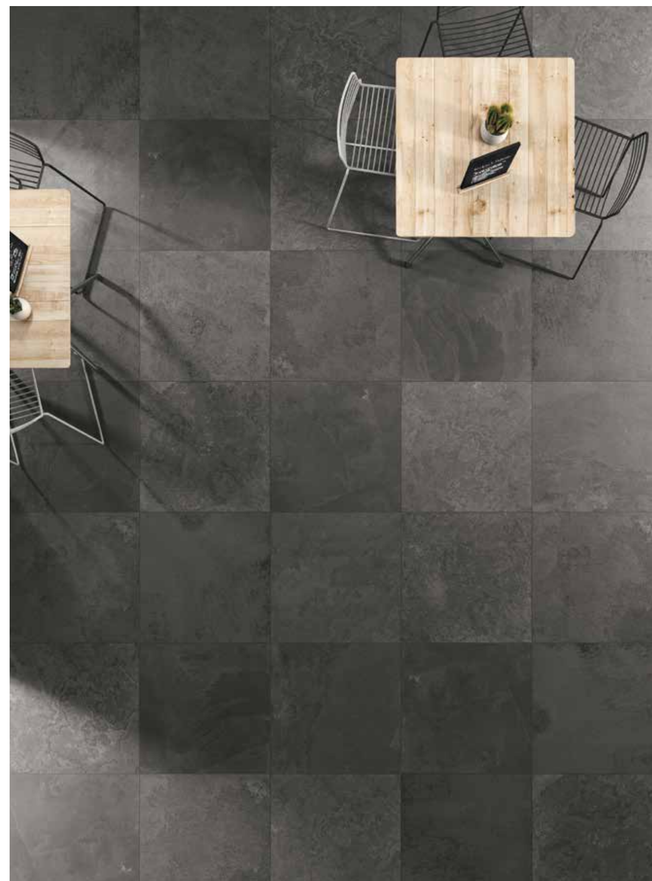
Antracite Base 75x75 - 30"x30" Naturale/Rettificato