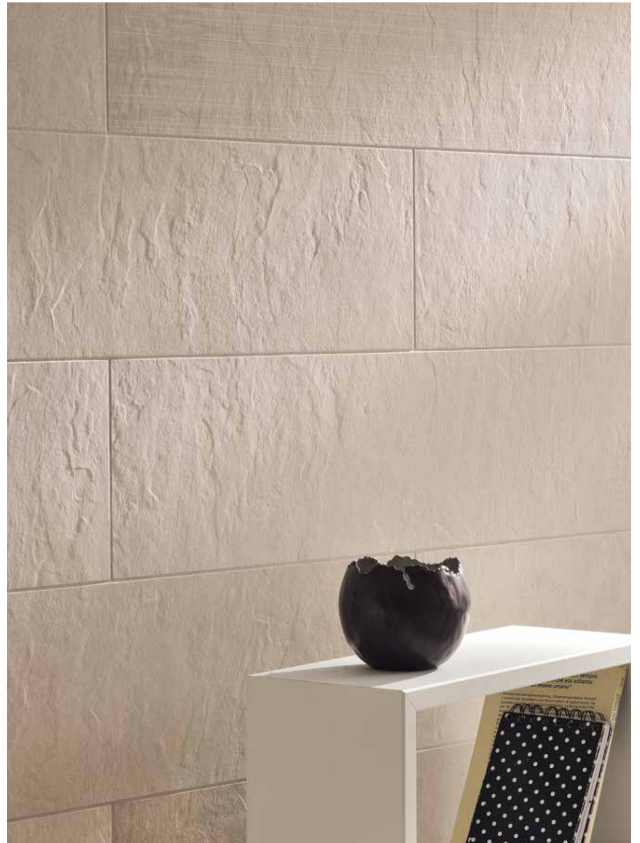
Avorio Mix 18,75x75 - 7 1/2"x30" Naturale/Rettificato