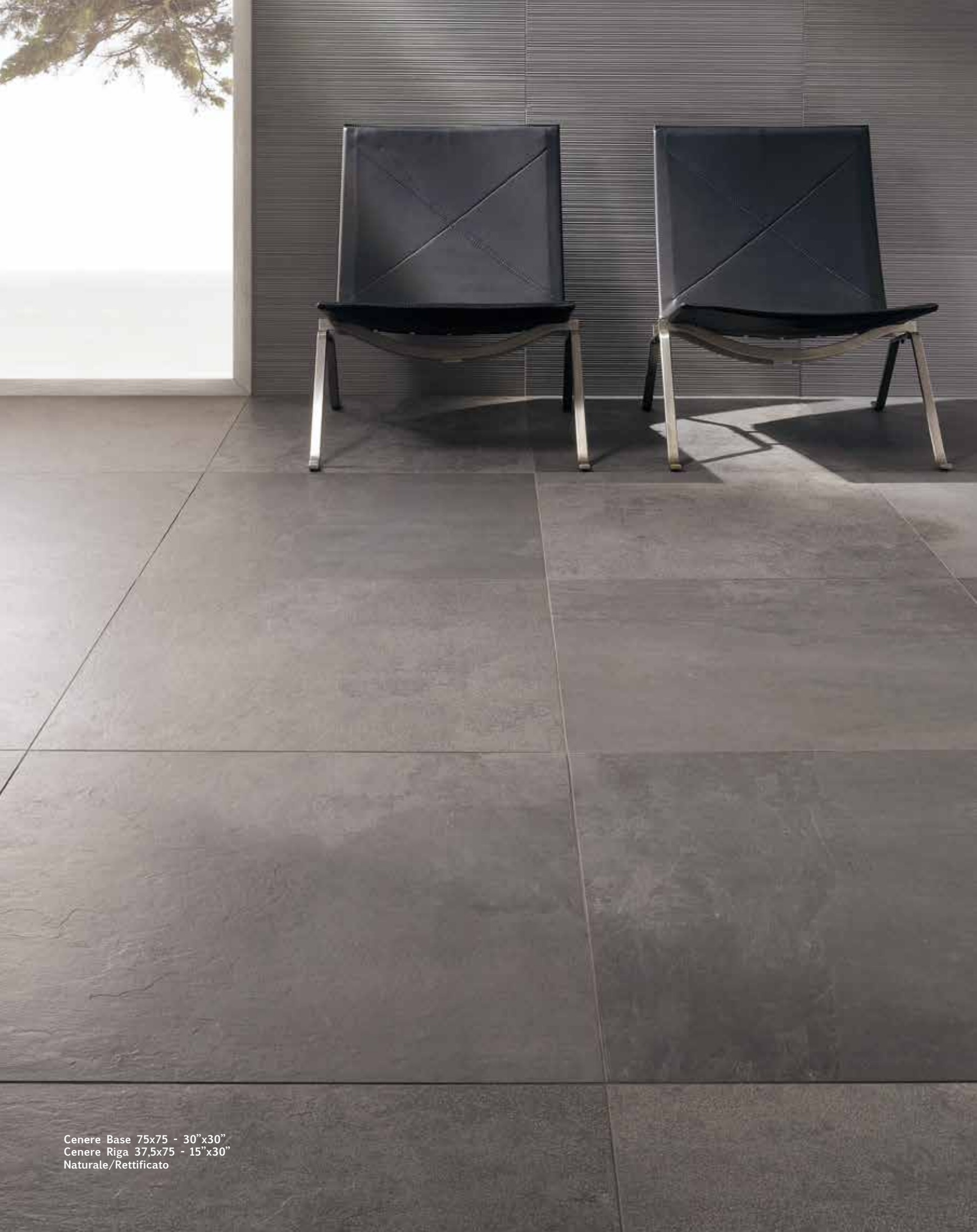
Cenere Base 75x75 - 30"x30" Cenere Riga 37,5x75 - 15"x30" Naturale/Rettificato