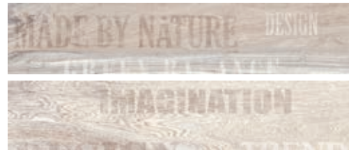
Deco Tiger Gris 13,4x66,2