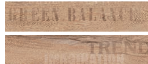
Deco Tiger Natural 13,4x66,2