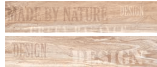
Deco Tiger Miel 13,4x66,2