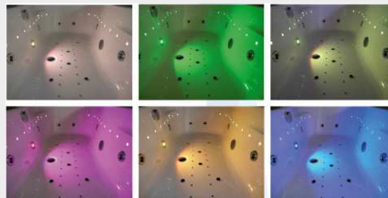
Варианты галогеновых подсветок

Срок производства гидромассажной ванны от 5 рабочих дней до 2-х месяцев (в зависимости от наличия заказных позиций). На ванны распространяется гарантия 2.5 года (30 месяцев), бесплатный запуск или установка Сервисным Центром который действует в 28 городах Украины