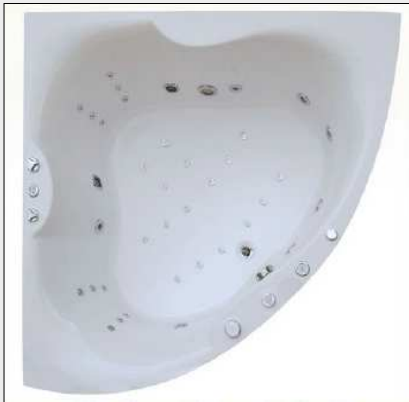
Ванна Kalipso 1.5 с гидромассажной системой “Kalipso Magic Plus”