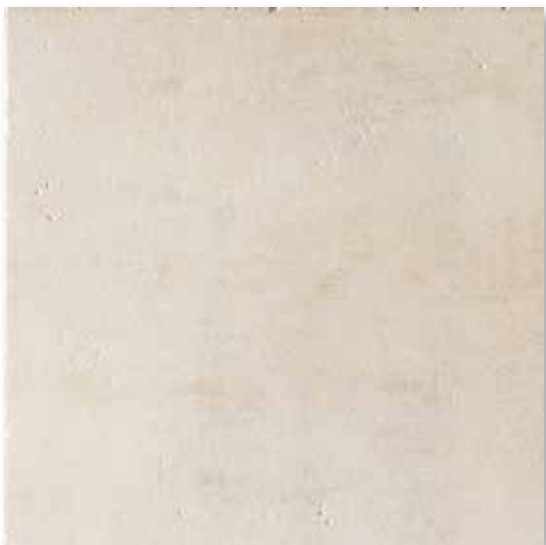
M 48 P50F15 Avorio 50x50

Decori - decors - decorations - dekore - decoros - декор