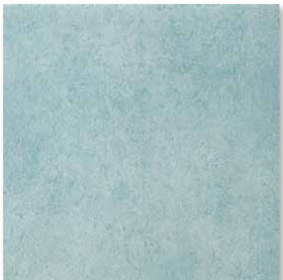
M 48 P50F21 Celeste 50x50

Gres Porcellanato ad impasto colorato - Porcelain stoneware with colored tile body - Grès cérame coloré dans la masse