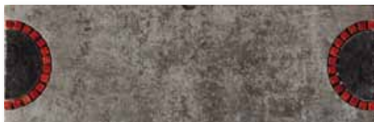
P 76 P165F17MA Fascia Miró Antracite 16,5x49,5