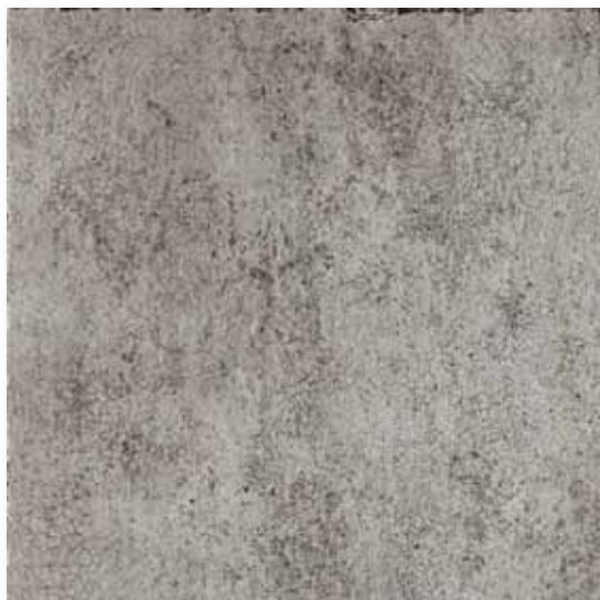
M 48 P50F17 Grigio 50x50

Decori - decors - decorations - dekore - decoros - декор