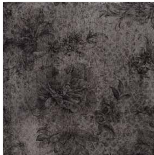
P 66 P50F20ORT Inserto Okyo Antracite