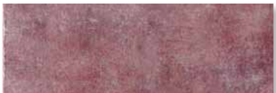
M 59 P165F18RT Lilla Rett. 16,5x49,5