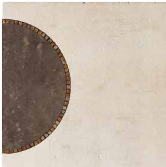
P 81 P50F15MT Decoro Miró Tabacco 49,5x49,5