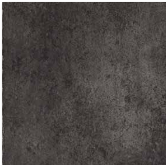
M 48 P50F20 Antracite 50x50

Decori - decors - decorations - dekore - decoros - декор