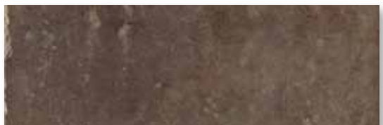
M 59 P165F19RT Tabacco Rett. 16,5x49,5