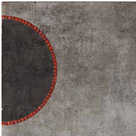
P 81 P50F17MA Decoro Miró Antracite 49,5x49,5

Decori - decors - decorations - dekore - decoros - декор