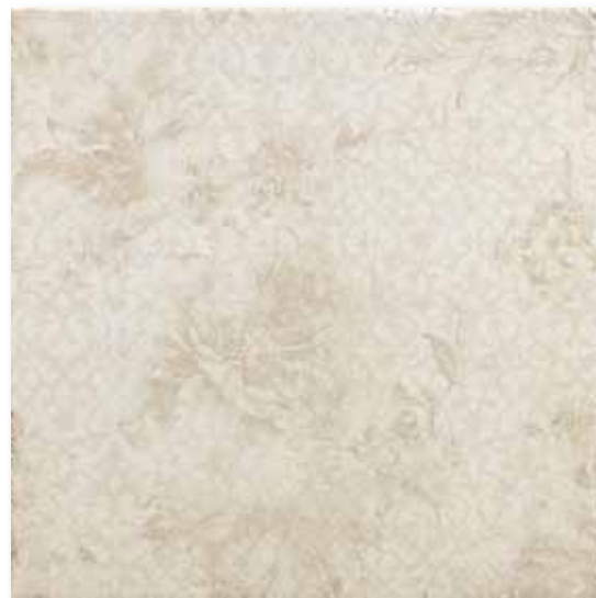
P 66 P50F15ORT Inserto Okyo Avorio 49,5x49,5