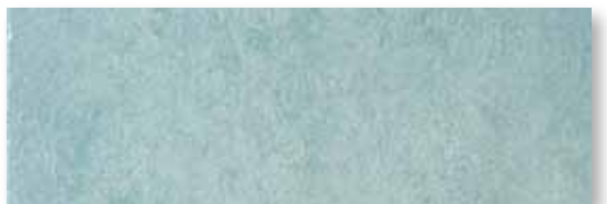
M 59 P165F21RT Celeste Rett. 16,5x49,5