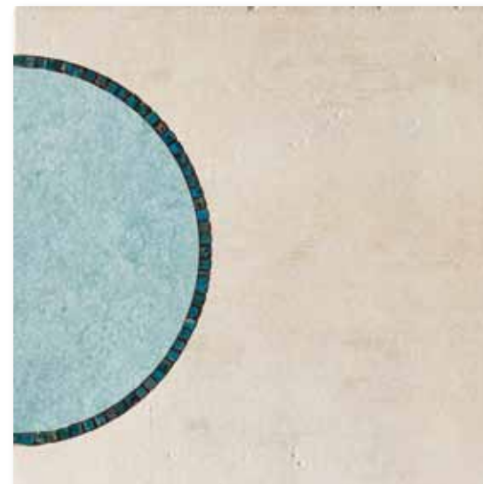
P 81 P50F15MC Decoro Miró Celeste 49,5x49,5