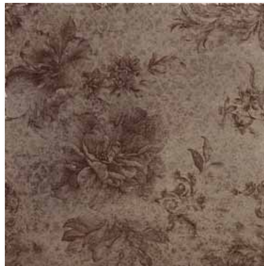
P 66 P50F19ORT Inserto Okyo Tabacco 49,5x49,5