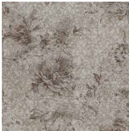
P 66 P50F17ORT Inserto Okyo Grigio 49,5x49,5