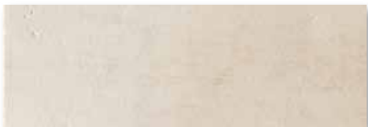
M 59 P165F15RT Avorio Rett. 16,5x49,5