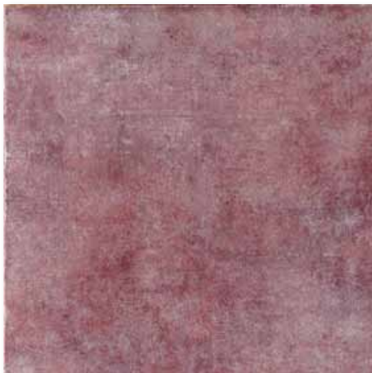
M 48 P50F18 Lilla 50x50

Gres Porcellanato ad impasto colorato - Porcelain stoneware with colored tile body - Grès cérame coloré dans la masse