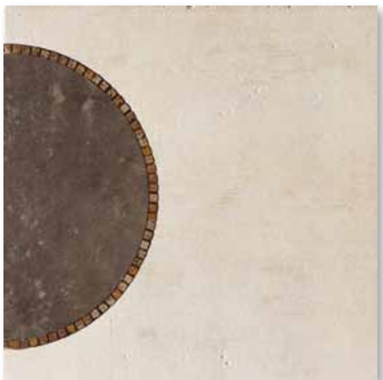
P 81 P50F15MT Decoro Miró Tabacco 49,5x49,5

Decorì - decors - decorations - dekore - decoros - декор