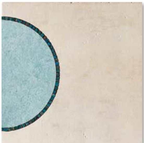
P 81 P50F15MC Decoro Miró Celeste 49,5x49,5

Decori - decors - decorations - dekore - decoros - декор