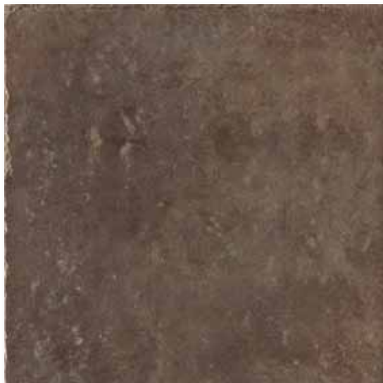
M 48 P50F19 Tabacco 50x50

Decori - decors - decorations - dekore - decoros - декор