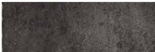
M 59 P165F20RT Antracite Rett. 16,5x49,5