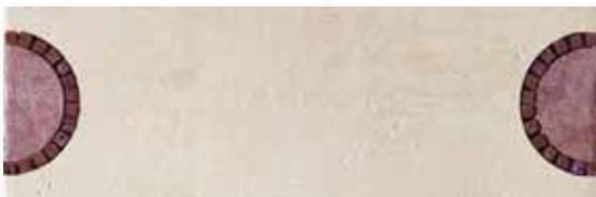
P 76 P165F15ML Fascia Miró Lilla 16,5x49,5