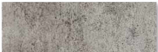
M 59 P165F17RT Grigio Rett. 16,5x49,5