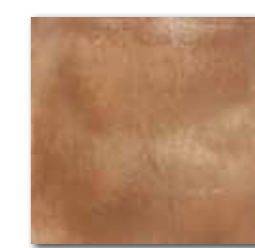
DAR34713 PEI 4 ○ 76 / m 2 mat | matt