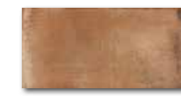
DARJH713 PEI 4 ○ 84 / m 2 mat | matt