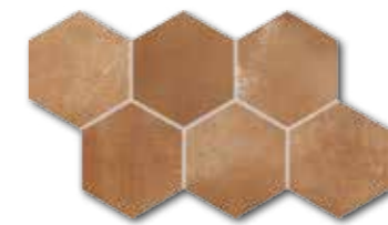
DDVT8713 (SET) PEI 4 ○ 74 / set mat | matt

červeno-hnědá / red-brown / czerwono-brązowy красно-коричневый / vörösesbarna / de color marrón rojizo