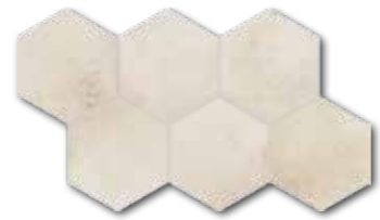
DDVT8710 (SET) PEI 5 ○ 74 / set mat | matt

světle béžová / light beige / jasno-bežová светло-бежевый / világosbézs / beige claro