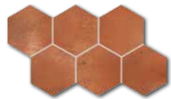
DDVT8712 (SET) PEI 4 ○ 74 / set mat | matt

šedá / grey / szara / серый / szürke / gris