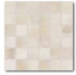
DDM05710 (SET) PEI 5 ○ 72 / set mat | matt