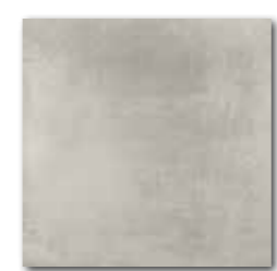
DAR34711 PEI 4 ○ 76 / m 2 mat | matt