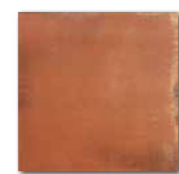
DAR34712 PEI 4 ○ 76 / m 2 mat | matt