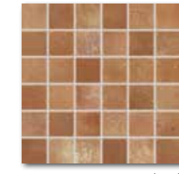
DDM05713 (SET) PEI 4 ○ 72 / set mat | matt