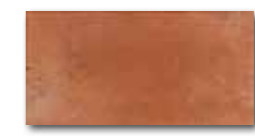
DARJH712 PEI 4 ○ 84 / m 2 mat | matt