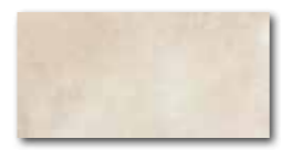
DARJH710 PEI 5 ○ 84 / m 2 mat | matt