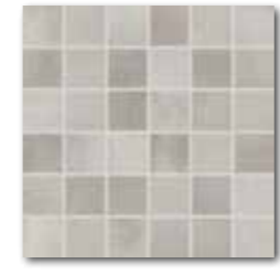
DDM05711 (SET) PEI 4 ○ 72 / set mat | matt