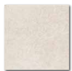
DAR34710 PEI 5 ○ 76 / m 2 mat | matt