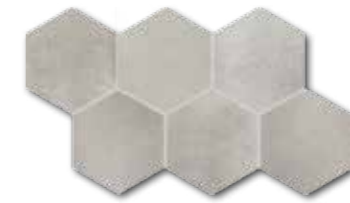
DDVT8711 (SET) PEI 4 ○ 74 / set mat | matt

světle béžová / light beige / jasno-bežová светло-бежевый / világosbézs / beige claro