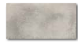
DARJH711 PEI 4 ○ 84 / m 2 mat | matt