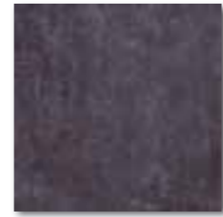
DAR35114 PEI 5 ○ 76 / m 2 mat | matt