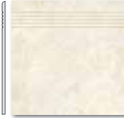
DCA35111 PEI 5 ○ 44 / ks mat | matt