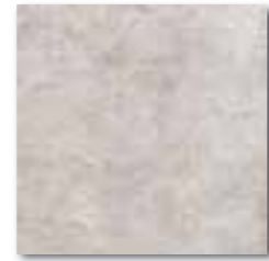
DAR35110 PEI 5 ○ 76 / m 2 mat | matt