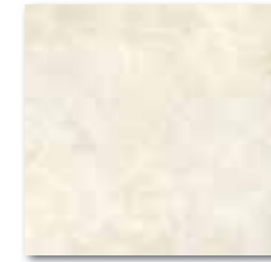
DAR35111 PEI 5 ○ 76 / m 2 mat | matt