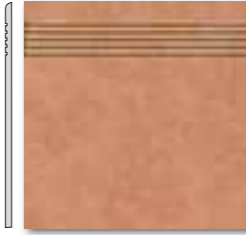
DCA35115 PEI 5 ○ 44 / ks mat | matt