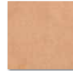
DAR35117 PEI 5 ○ 76 / m 2 mat | matt