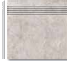
DCA35110 PEI 5 ○ 44 / ks mat | matt