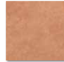
DAR35115 PEI 5 ○ 76 / m 2 mat | matt