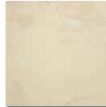
DAA44294 PEI 4 ○ 78 / m 2 mat | matt