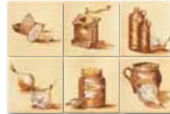
WIT1B043 (SET) ○ 78 / set mat | matt