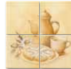
WIT32258 (SET) ○ 52 / set mat | matt