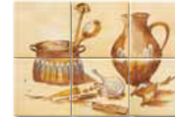
WITP4035 (SET) ○ 76 / set mat | matt