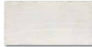
WADMB010 78 / m 2 mat | matt