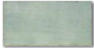
WADMB015 78 / m 2 mat | matt