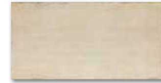
WADMB011 78 / m 2 mat | matt