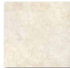
DAR35111 Andalusia PEI 5 76 / m 2 mat | matt slonová kost / ivory kość słoniowa / слононая кость / elefántcsont