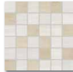
WDM05014 (SET) 66 / set mat | matt světle béžová / light beige jasnobežova / светло-бежевый / világosbézs