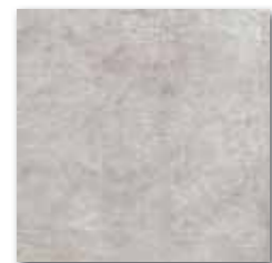
DAR35110 Andalusia PEI 5 76 / m 2 mat | matt světle šedá / light grey jasnoszara / светло-серый / világosszürke