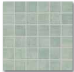
WDM05015 (SET) 66 / set mat | matt zelená / green zielona / зеленый / zöld