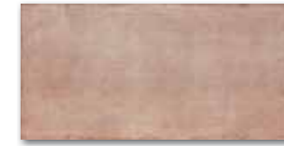
WADMB012 78 / m 2 mat | matt