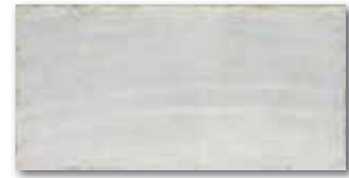
WADMB013 78 / m 2 mat | matt