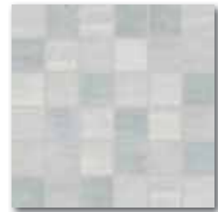
WDM05013 (SET) 66 / set mat | matt světle šedá / light grey jasnoszara / светло-серый / világosszürke