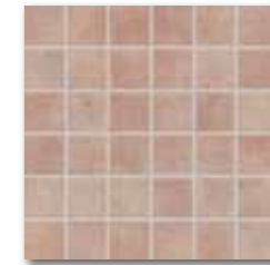
WDM05012 (SET) 66 / set mat | matt cihlová / brick ceglasta / кирпичный / tégla