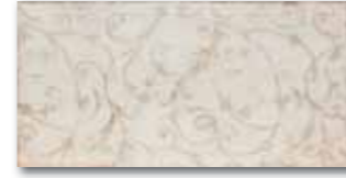
WITMB040 64 / ks mat/lesk | matt/glossy