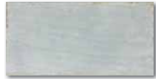
WADMB014 78 / m 2 mat | matt šedomodrá / gray-blue szaro-niebieska / серо-голубой / szürke-kék