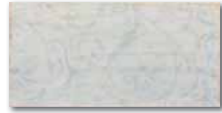
WITMB041 64 / ks mat/lesk | matt/glossy