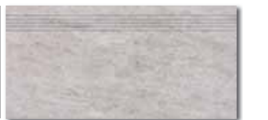
DCPSE631 PEI 5 ○ 72 / ks mat | matt