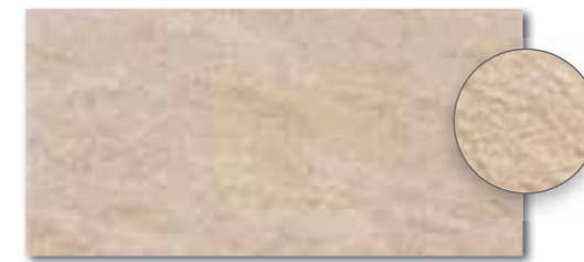
DARSE629 PEI 5 ○ 80 / m 2 mat | matt