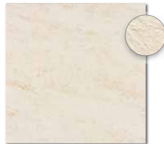
DAR63628 PEI 5 ○ 86 / m 2 mat | matt