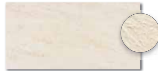
DARSE628 PEI 5 ○ 80 / m 2 mat | matt