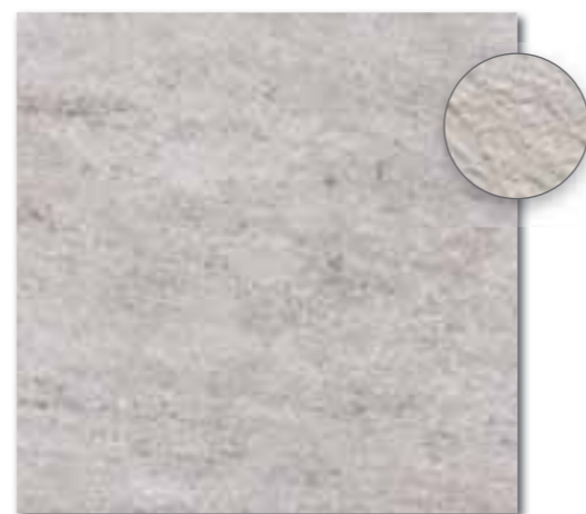
DAR63631 PEI 5 ○ 86 / m 2 mat | matt