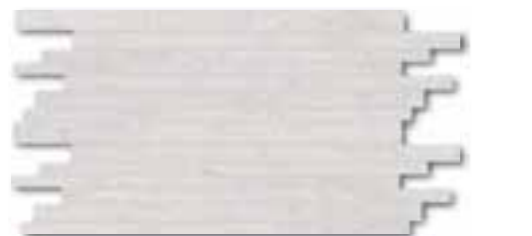
DDPSE630 PEI 5 ○ 78 / set mat | matt