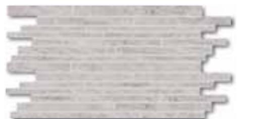
DDPSE631 PEI 5 ○ 78 / set mat | matt