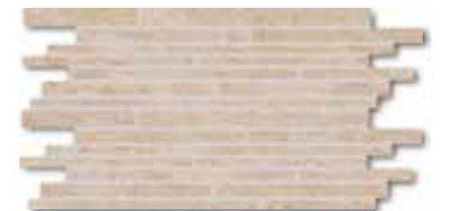
DDPSE629 PEI 5 ○ 78 / set mat | matt