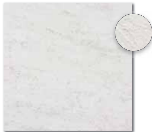
DAR63630 PEI 5 ○ 86 / m 2 mat | matt