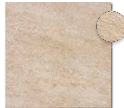
DAR63629 PEI 5 ○ 86 / m 2 mat | matt