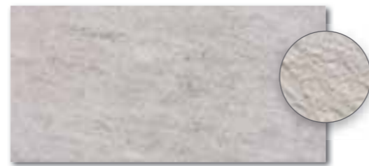
DARSE631 PEI 5 ○ 80 / m 2 mat | matt