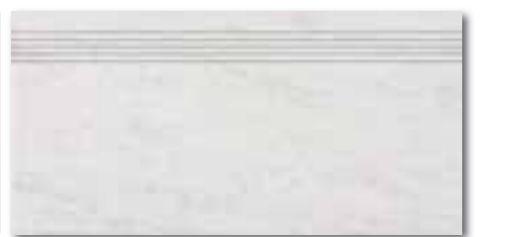
DCPSE630 PEI 5 ○ 72 / ks mat | matt