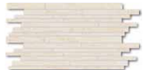
DDPSE628 PEI 5 ○ 78 / set mat | matt