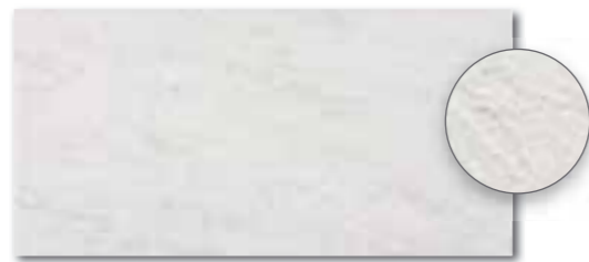
DARSE630 PEI 5 ○ 80 / m 2 mat | matt