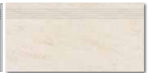
DCPSE628 PEI 5 ○ 72 / ks mat | matt