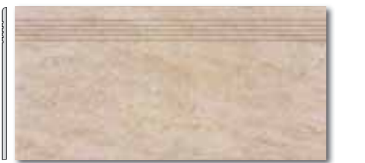
DCPSE629 PEI 5 ○ 72 / ks mat | matt