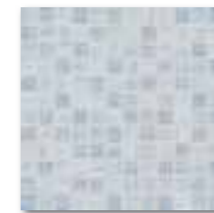
WDM02232 (SET) 78 / set mat/lesk | matt/glossy modrá / blue / niebieska / голубой / kék