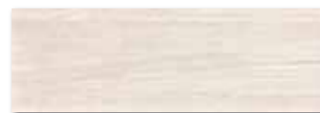
WADVE029 ○ 82 / m 2 lesk | glossy světle béžová / light beige / jasnobežowa светло-бежевый / világosbézs