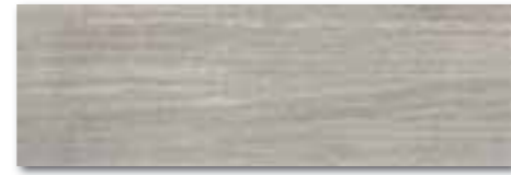
WADVE028 82 / m 2 lesk | glossy