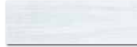
WADVE031 82 / m 2 lesk | glossy

světle modrá / light blue / jasnyniebieska светло-голубой / világoskék