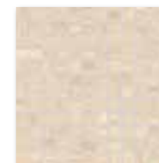
WDM02230 (SET) ○ 78 / set mat/lesk | matt/glossy béžová / beige / bežowa / бежевый / bézs