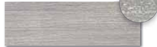
WITVE128 74 / ks mat | matt