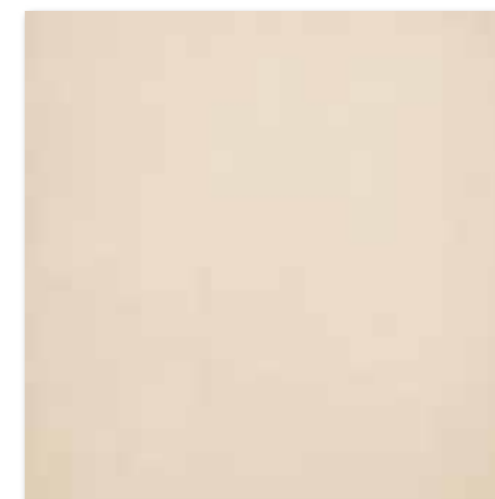
DAK63658 Trend PEI 5 ○ 82 / m 2 mat | matt světle béžová / light beige / jasnobežowa светло-бежевый / világosbézs