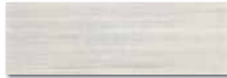
WADVE027 82 / m 2 lesk | glossy

světle šedá / light grey / jasnoszara светло-серый / világosszürke