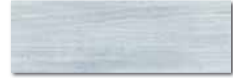
WADVE032 82 / m 2 lesk | glossy