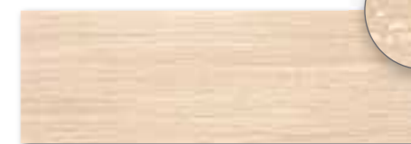
WITVE130 ○ 74 / ks mat | matt