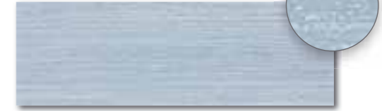
WITVE132 74 / ks mat | matt