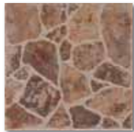
DAR3B001 PEI 4 \odot 72 / m 2 mat | matt