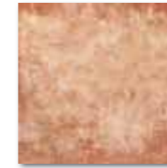
GAR35671 PEI 4 \odot 64 / m 2 mat | matt hnědá / brown / brązowa коричневый / barna