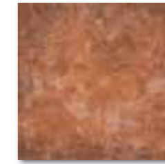
GAR35672 PEI 4 \odot 64 / m 2 mat | matt tmavě hnědá / dark brown / ciemnobrązowa темно-коричневый / sötétbarna