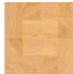
GAS3B001 PEI 3 \odot 66 / m 2 mat | matt hnědá / brown / brązowa коричневый / barna