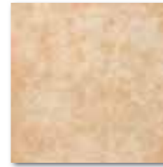
GAR35670 PEI 4 \odot 64 / m 2 mat | matt běžová / beige / bežowa бежевый / bézs