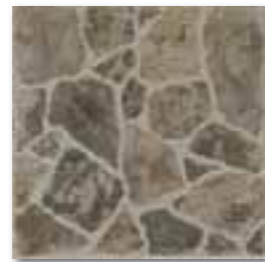
DAR3B002 PEI 4 \odot 72 / m 2 mat | matt