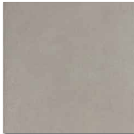
DAR63640 Clay PEI 4 ○ 86 / m 2 mat | matt

béžovošedá / beige-grey / beżowo-szary бежевый-серый / bézs-szürke