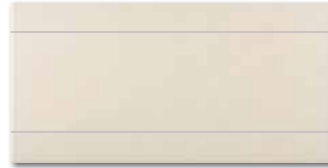
WIFV4102 ○ 58 / ks mat | matt

světle béžová / light beige jasnobežová / светло-бежевый / világosbézs