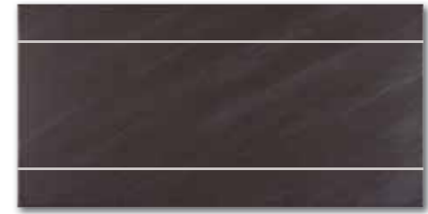
WIFV4104 ○ 58 / ks mat | matt

světle béžová / light beige jasnobežová / светло-бежевый / világosbézs