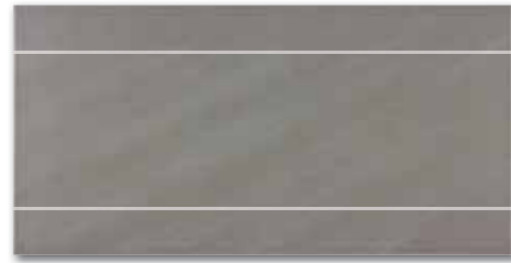
WIFV4103 ○ 58 / ks mat | matt