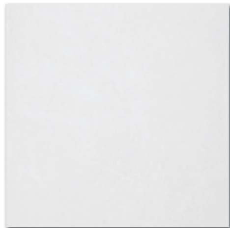
DAR63638 Clay PEI 5 ○ 86 / m 2 mat | matt