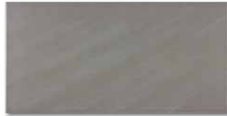
WATV4103 ○ 82 / m 2 mat | matt