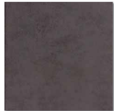
DAR63641 Clay PEI 4 ○ 86 / m 2 mat | matt

světle béžová / light beige jasnobežová / светло-бежевый / világosbézs