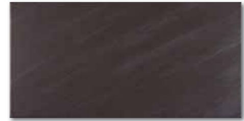
WATV4104 ○ 82 / m 2 mat | matt