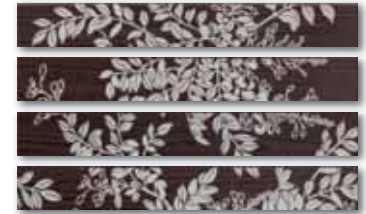
WLAPP001 (SET) ○ 84 / set mat/lesk | matt/glossy hnědá / brown brązowa / коричневый / barna