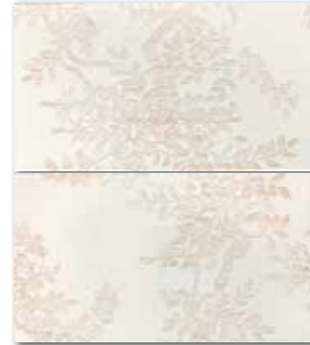
WITP3019 (SET) ○ 82 / set mat/lesk | matt/glossy bilá / white biata / белый / fehér