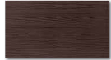
WATP3025 ○ 78 / m 2 mat/lesk | matt/glossy