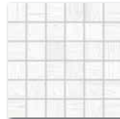
WDM05024 (SET) ○ 66 / set mat/lesk | matt/glossy