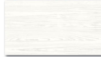
WATP3024 ○ 78 / m 2 mat/lesk | matt/glossy