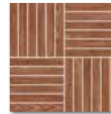
DDV1V620 (SET) PEI 4 ○ 72 / set mat | matt