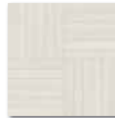
DDV1V618 (SET) PEI 5 ○ 72 / set mat | matt