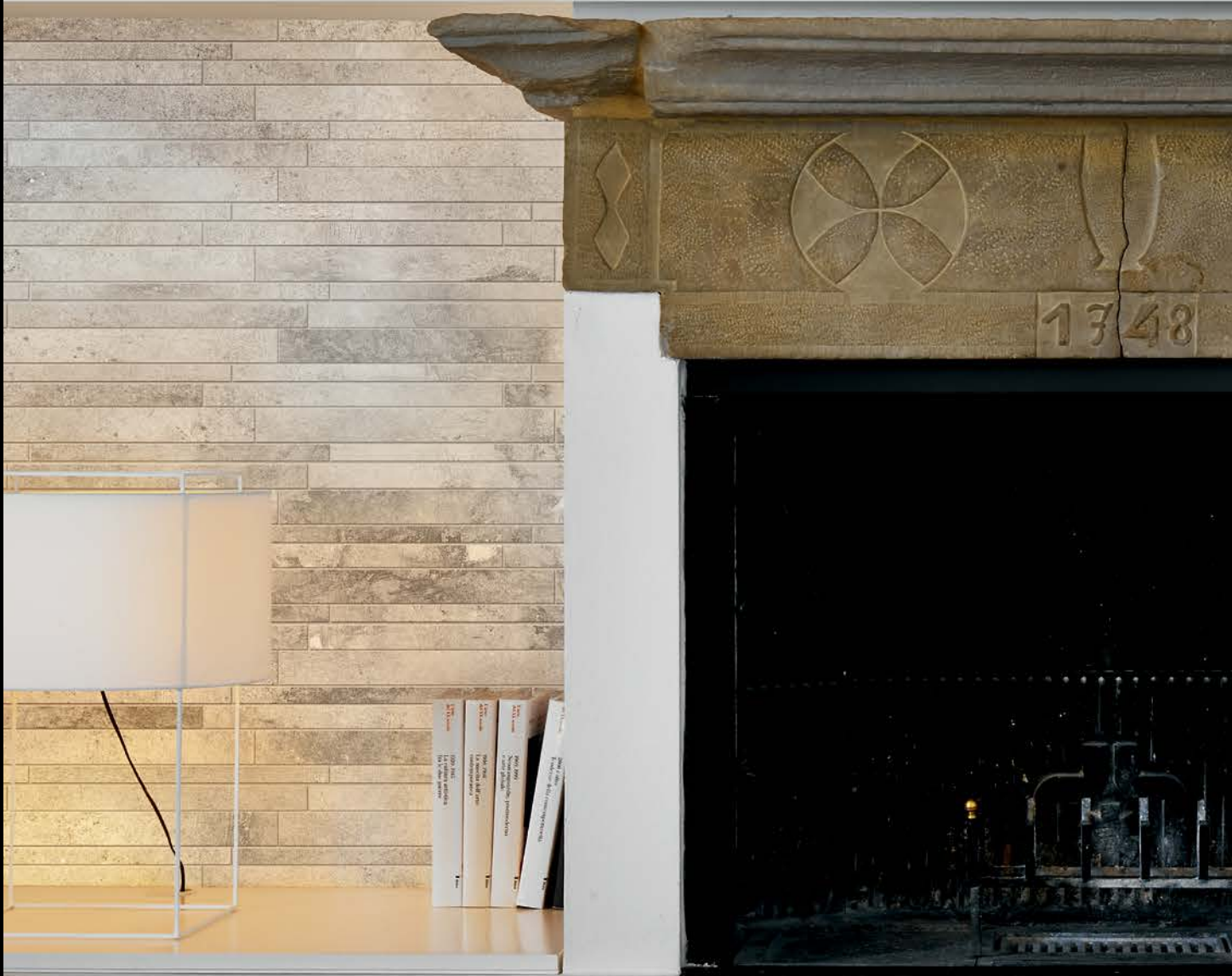
wall: la roche grey modulo listello sfalsato mix 21x40 8 1 / 4 "x15 3 / 4 " floor: la roche grey 80x80 31 1 / 2 "x31 1 / 2 "